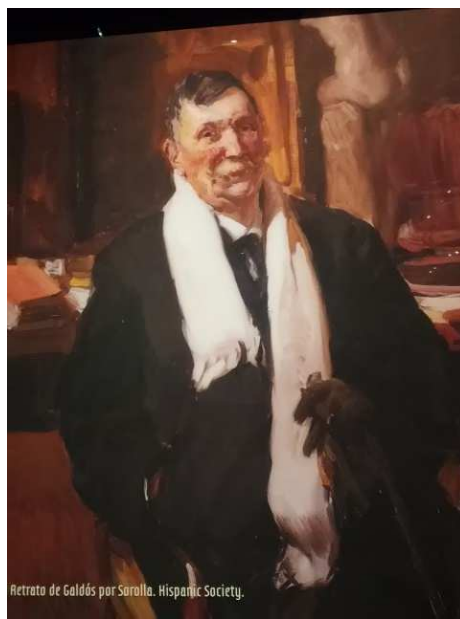
Retrato de Galdós por Sarolla. Hispanic Society.